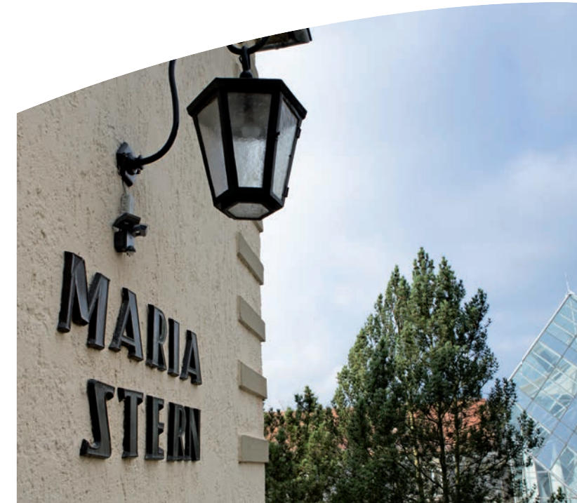
Adaptionseinrichtung „Maria Stern“

Haus Saaletal Campus Bad Neustadt Medizinische Exzellenz aus Tradition